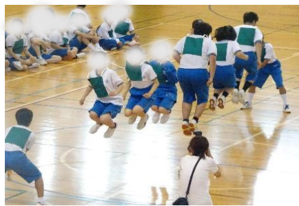
(高)「みんなでジャンプ！」