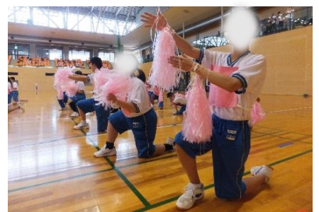
(高)「演技発表：ダンス」