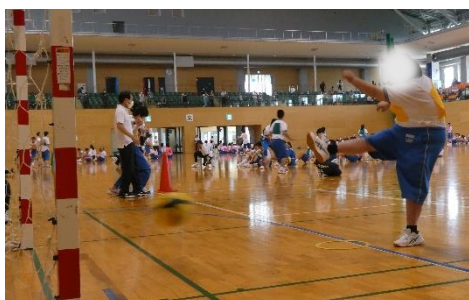
(高)「シュートリレー」